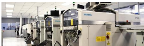
Vista da linha de montagem LED- Pulse Pinhais-PR