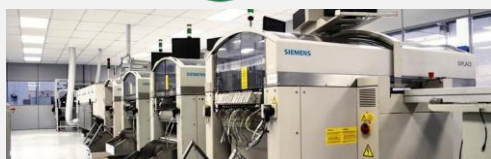
Vista da linha de montagem LED- Pulse Pinhais-PR