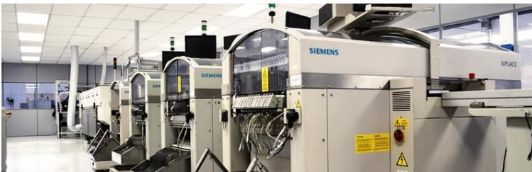
Vista da linha de montagem LED- Pulse Curitiba - PR

Luminária desenvolvida no Brasil com tecnologia da Seoul Semiconductor.