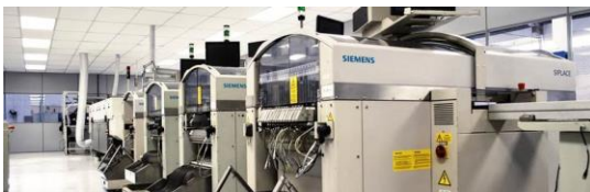
Vista da linha de montagem LED- Pulse Pinhais-PR