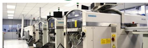
Vista da linha de montagem LED- Pulse Pinhais-PR